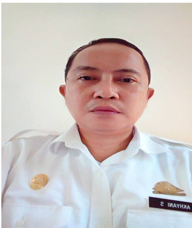
Sekretaris Badan Penelitian dan Pengembangan Kabupaten Gowa