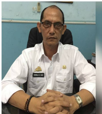
Kepala Badan Penelitian dan Pengembangan Kabupaten Gowa