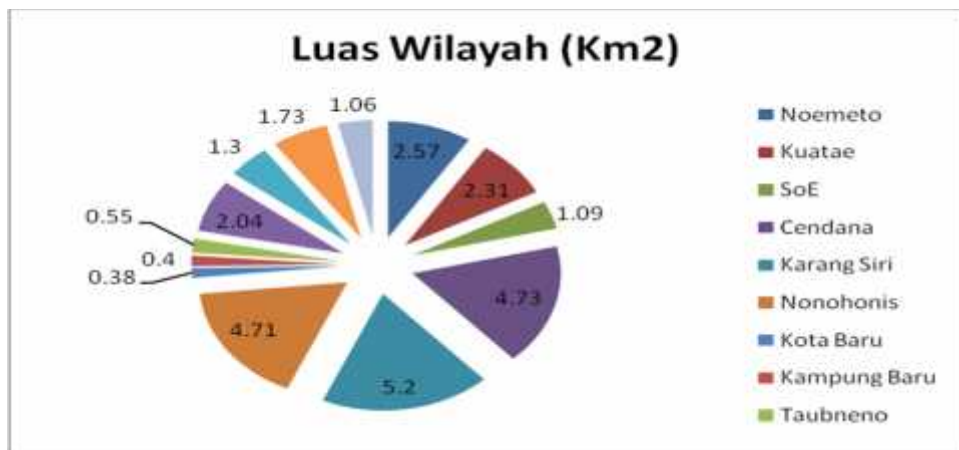
➤ Gambar 2.1. GAMBAR/DIAGRAM LUAS WILAYAH