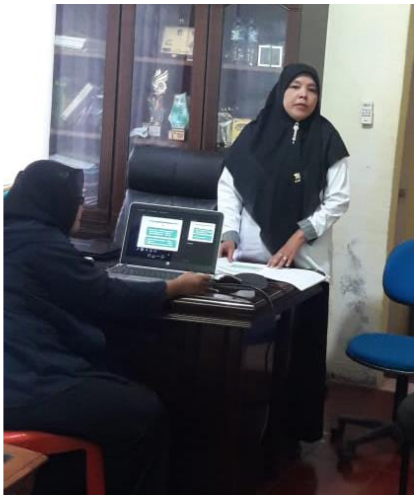
Ekspose Kepala UPTD BPP Kec Talawi