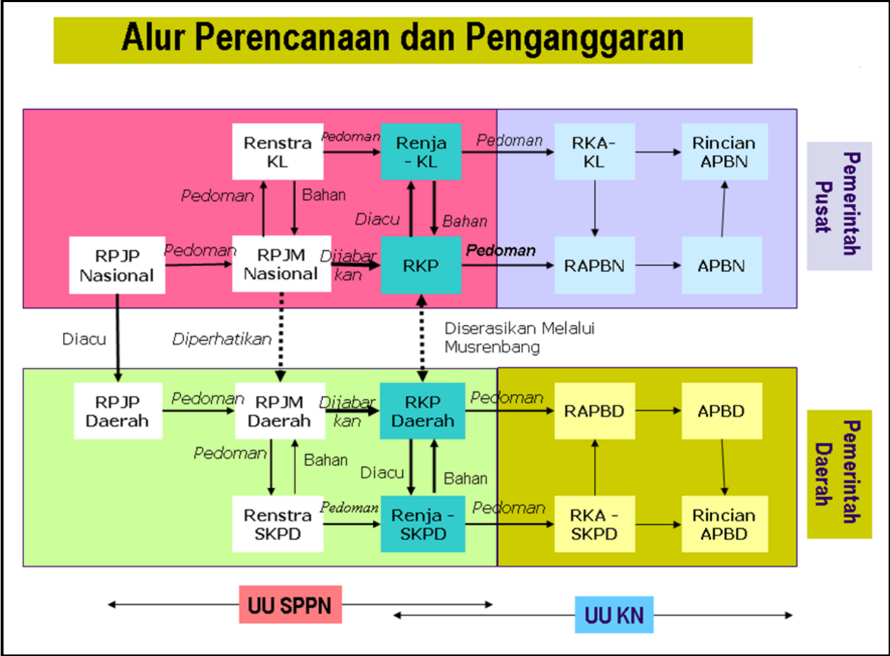
Gambar 1. Hubungan Renstra dan Dokumen Perencanaan Lainnya

Pada gambar di atas dapat dilihat bahwa proses penerjemahan kebijakan atau janji politik Kepala Daerah diterjemahkan ke dalam bahasa birokrasi melalui Rencana Pembangunan Jangka Menengah Daerah (RPJMD) yang merupakan penjabaran visi misi dan program Kepala Daerah yang memuat tujuan, sasaran, strategi dan arah kebijakan yang disusun berpedoman pada RPJPD, RTRW dan RPJMN. Penjabaran RPJMD dituangkan dalam RKPD yang memuat kerangka ekonomi daerah, prioritas pembangunan daerah yang merupakan janji politik kepala daerah serta rencana kerja perangkat daerah yang disusun berpedoman pada RKP yang diserasikan melalui musrenbang dan Program strategis nasional. RKPD dijadikan pedoman dalam menyusun RAPBD yang akan ditetapkan menjadi APBD. Rencana Strategis Perangkat Daerah yang memuat tujuan, sasaran, program dan kegiatan pembangunan sesuai urusan Pemerintahan wajib dan atau urusan pilihan yang disusun berpedoman pada RPJMD. Rencana Kerja Perangkat Daerah (Renja PD) disusun berpedoman kepada Rencana Strategis Perangkat Daerah (RKPD). Setelah RAPBD disusun, perangkat daerah menyusun RKA Perangkat Daerah berdasar pada renja perangkat daerah.