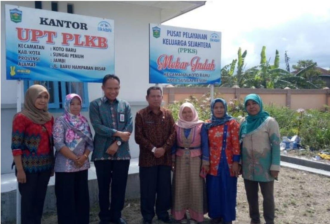
Kunjungan Sekaligus Pembinaan Bapak Kaper BKKBN Provinsi Jambi Dalam Acara Blusukan hasil progress back up data SR dan PK.