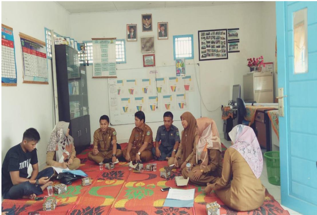
Pertemuan/rapat teknis program KKBPK