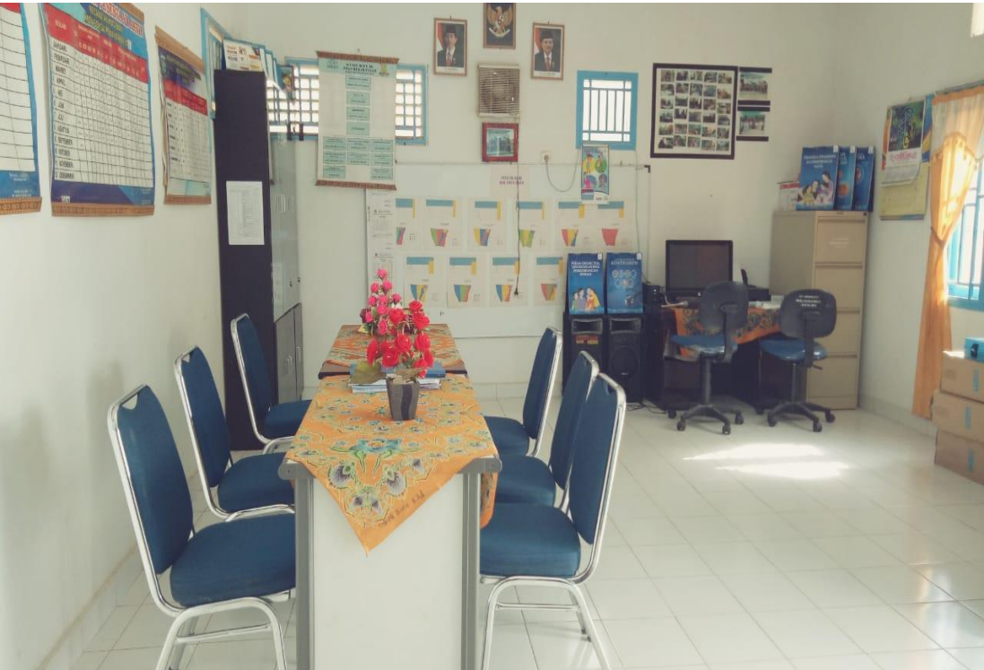
Keadaan Dalam Ruangn Balai Penyuluh KB Kecamatan Koto Baru.