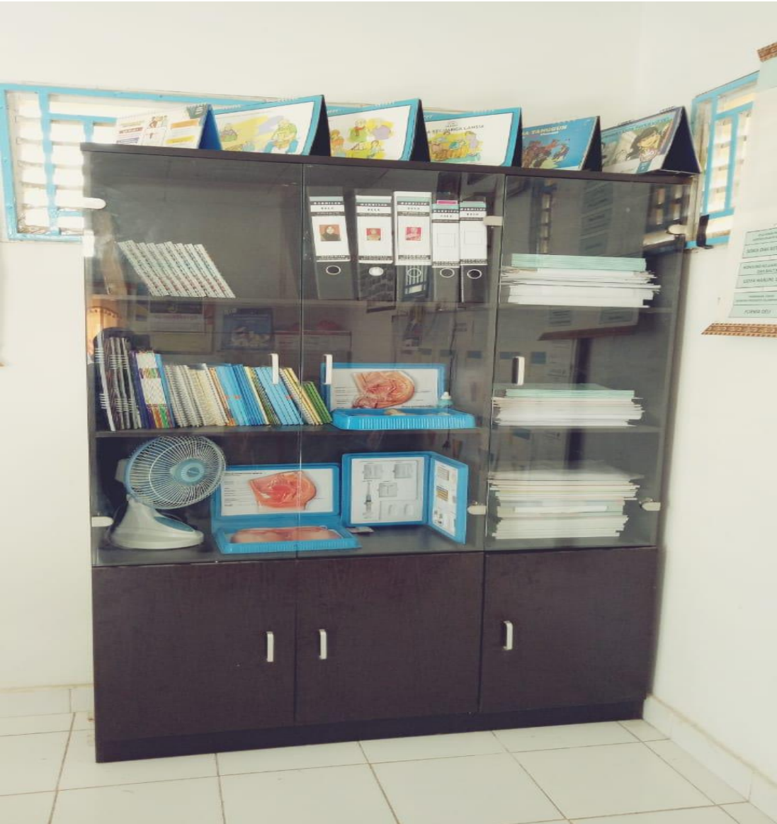
ATK Dan Fasilitas yang ada di Balai Penyuluh KB Kecamatan Koto Baru.