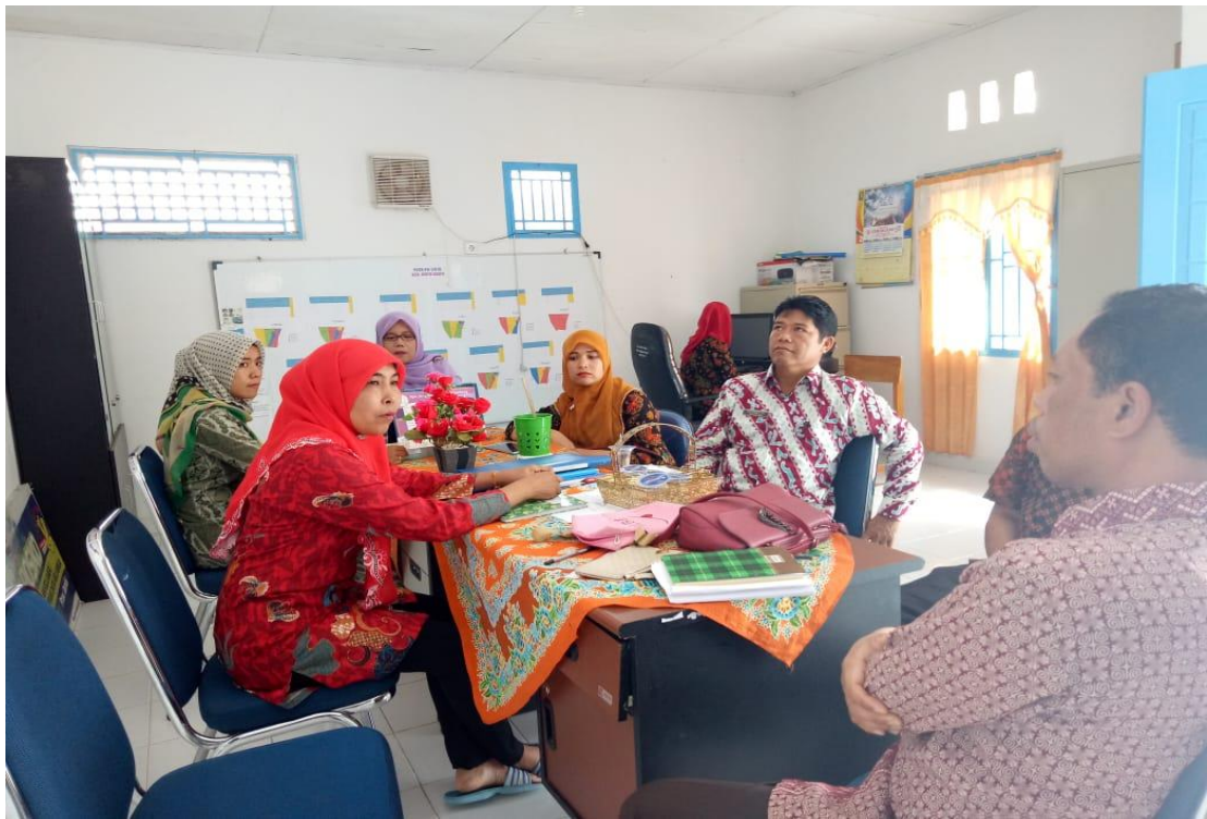
Kunjungan dan pembinaan dari Dinas PP dan KB Kota Sungai Penuh dalam rangka persiapan acara lomba PPKS Mekar Indah Tingkat Provinsi Jambi tahun 2018