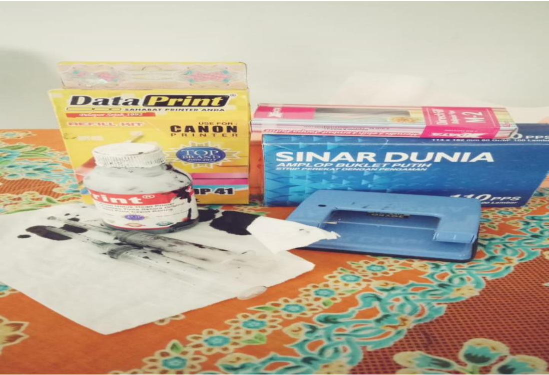
ATK Dan Fasilitas yang ada di Balai Penyuluh KB Kecamatan Koto Baru.