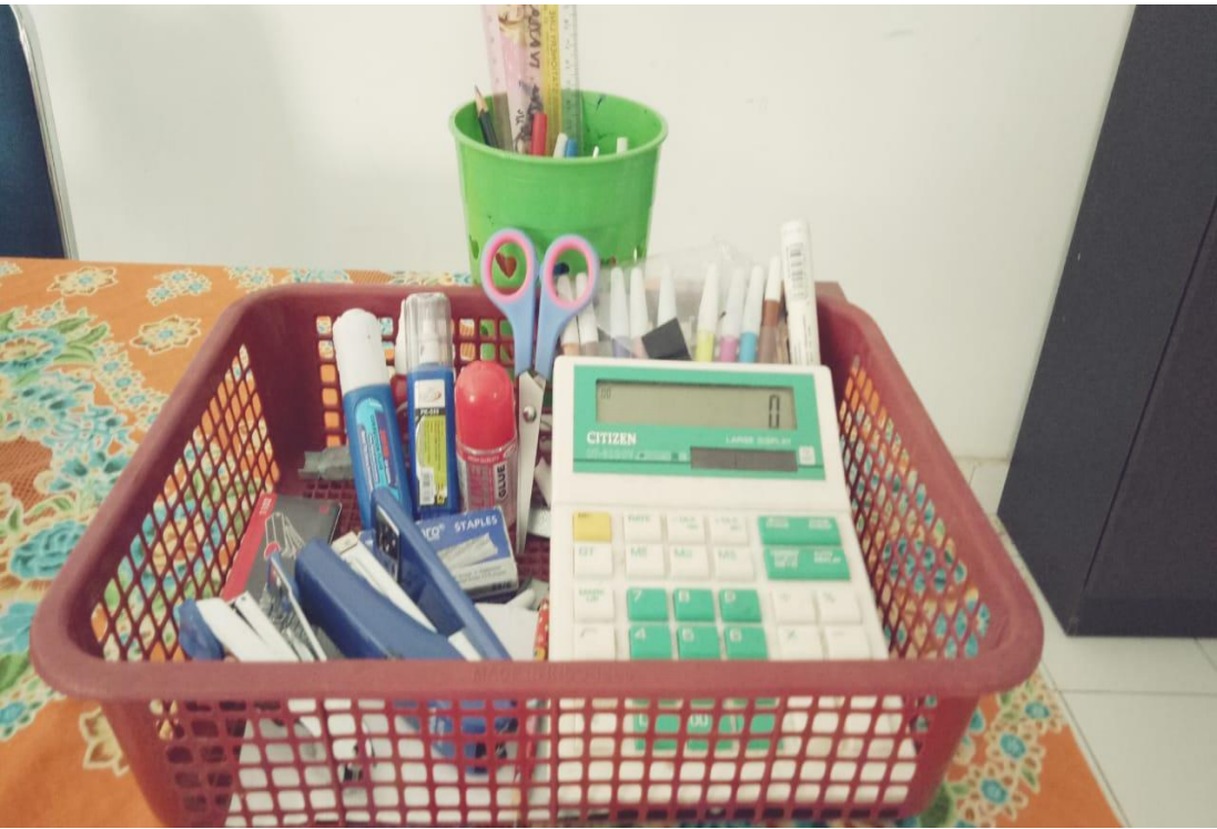
ATK Dan Fasilitas yang ada di Balai Penyuluh KB Kecamatan Koto Baru.