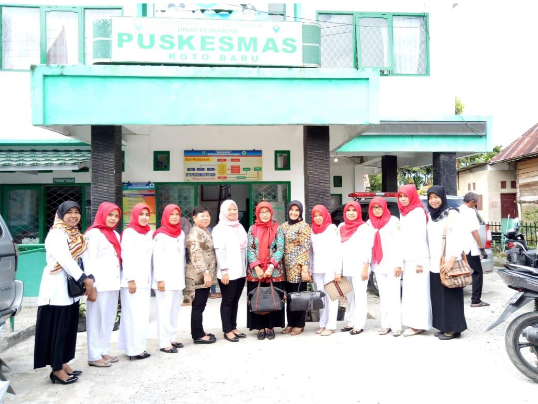
Selesai acara lomba Puskesmas Dalam Pelayanan MKJP Tingkat Provinsi di Klinik PKM koto Baru Kecamatan Koto Baru Kota Sungai Penuh tahun 2018