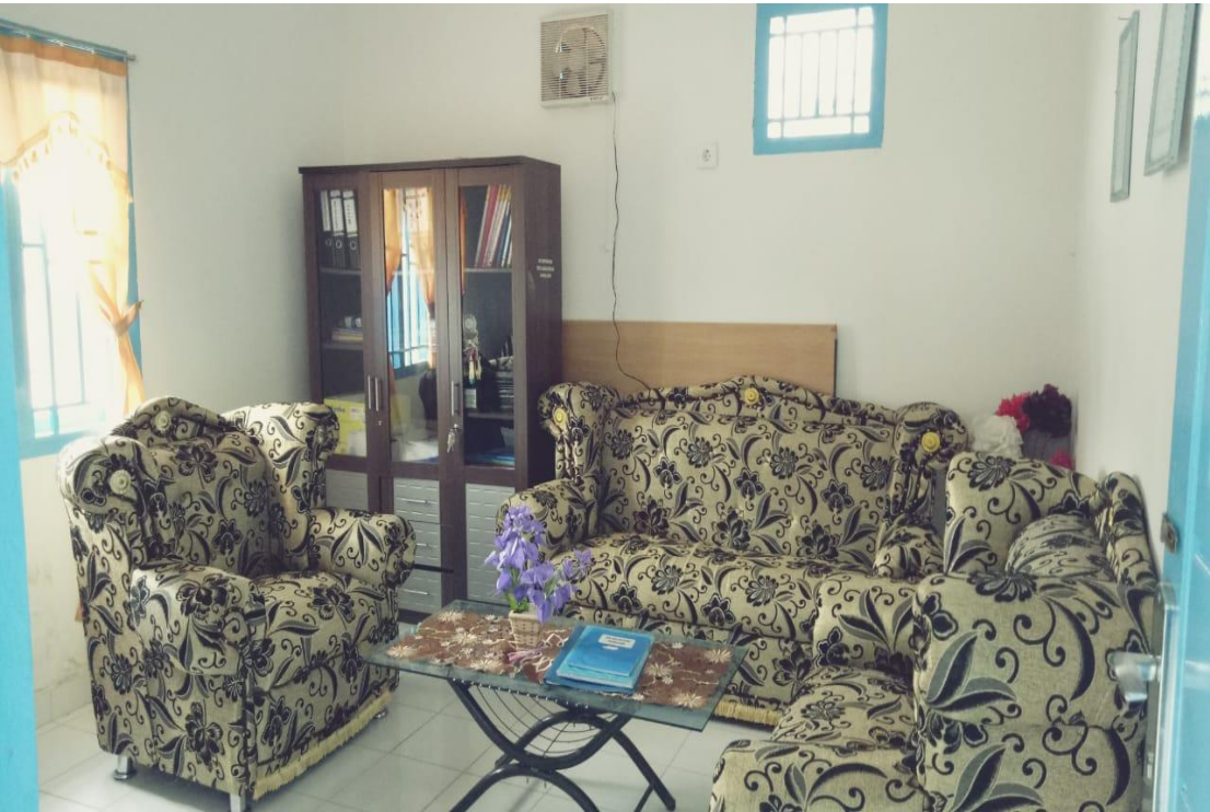
Kursi Tamu Ruang Koordinator Balai Penyuluh KB Kecamatan Koto Baru.