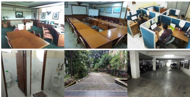
Gambar 10. Lingkungan kantor yang rapi, bersih, dan indah akan meningkatkan semangat kerja pegawai