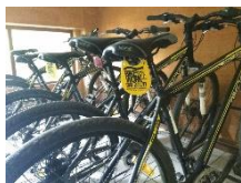
Gambar 11. Penyediaan Sepeda untuk Bekerja

Mobil kantor sebaiknya dilengkapi dengan unit bahan bakar gas (LGV) yang lebih hemat dan ramah lingkungan. Jika memungkinkan, disediakan fasilitas sepeda untuk mendorong pegawai tidak naik kendaraan bermotor saat bekerja sehingga mengurangi polusi udara.