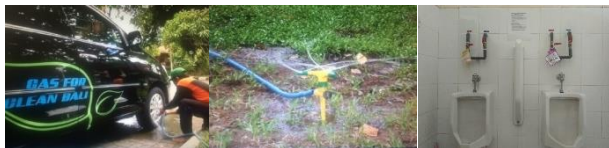
Gambar 6. Pemanfaatan air IPAL untuk mencuci mobil, menyiram tanaman, dan flushing toilet

Khusus bagi perkantoran yang menggunakan air tanah, perlu memperhatikan water balance dengan membuat lubang resapan biopori dan/atau sumur resapan agar air hujan dapat terserap masuk ke dalam tanah. Air bersih yang digunakan harus memenuhi persyaratan sesuai dengan peraturan perundang-undangan.