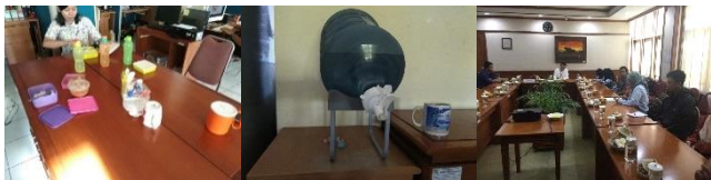
Gambar 3. Pengurangan sampah : membawa peralatan makan sendiri, penyediaan galon air isi ulang, dan penyediaan konsumsi rapat tanpa plastik dan kemasan