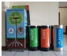
Gambar 4. Penyediaan Wadah Sampah di Kantor Sesuai Jenisnya

Pemilahan sampah dilakukan dengan memperhatikan persyaratan keamanan, kesehatan, lingkungan, kenyamanan, dan kebersihan.