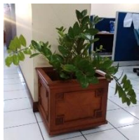
Gambar 9. Tanaman di dalam Ruangankantor

dan ekologis. Lahan RTH dapat dibuat lubang resapan biopori dan/atau sumur resapan untuk mengurangi genangan dan meningkatkan cadangan air tanah. Tanaman dalam pot juga dapat diadakan di dalam ruangan untuk menambah kesegaran (sirkulasi oksigen).