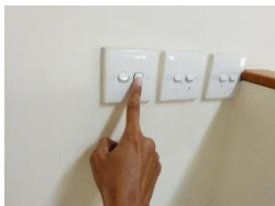
Gambar 7. Mematikan Lampu yang Tidak Digunakan

Pengoperasian peralatan elektronik di luar jam kerja seizin pimpinan/kepala kantor atau pejabat