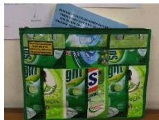
Gambar 5. Pemanfaatan Sampah Plastik Menjadi Tas