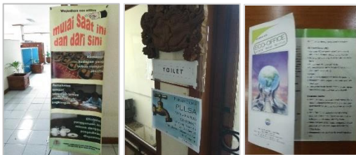
Gambar 2. Banner (Kiri), Kertas Himbauan (Tengah) dan Leaflet (Kanan) Sebagai Media Kampanye Kantor Peduli Lingkungan

media sosial), dan pemberian contoh perilaku ramah lingkungan di kantor.