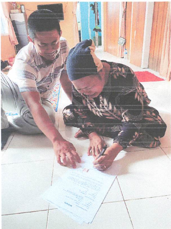
lampiran Surat Kuasa tanggal 1 Februari 2024