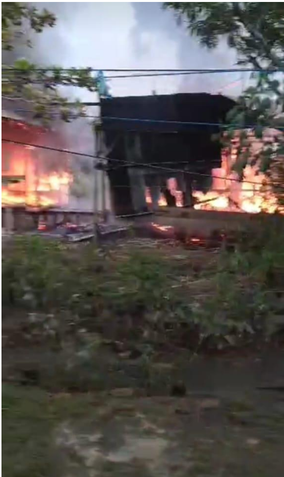
Dokumentasi kejadian bencana Kabakaran bangunan