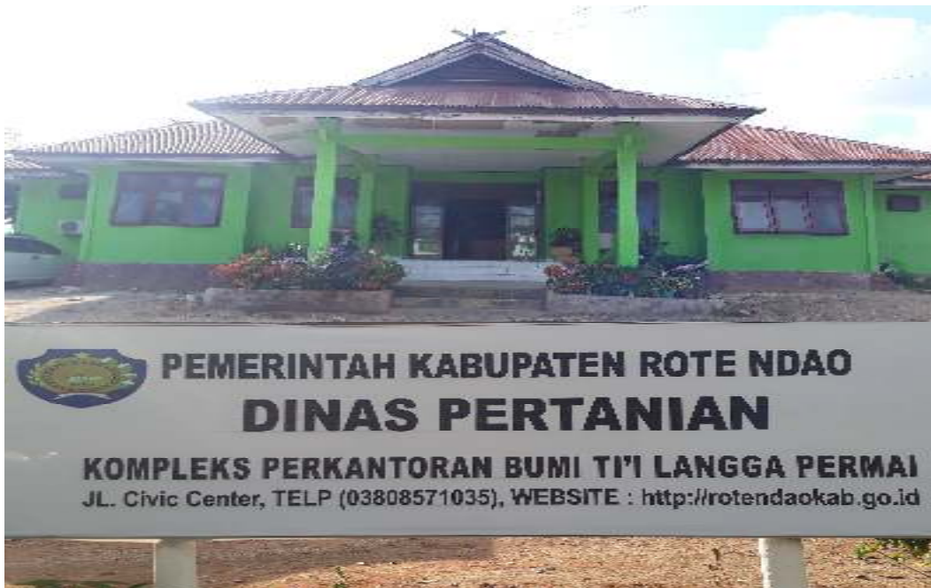
Kantor Dinas Pertanian dan Ketahanan Pangan Kabupaten Rote Ndao