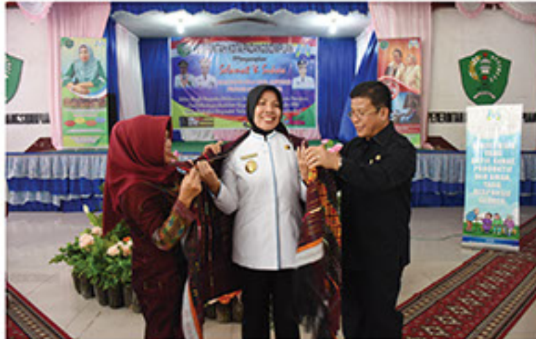
Padang Sidempuan, Wakil Gubernur Sumatera Utara Dr. Hj. Nurhajizah Marpaung, SH, MH berkunjung ke kota Padang Sidempuan dalam rangka percepatan pembangunan Pemberdayaan Perempuan dan Perlindungan Anak (PPPA) di Gedung Nasional Kota Padang Sidempuan, Rabu (21/2)

Wagubsu Nurhajizah mengatakan dalam rangka menindaklanjuti percepatan pembangunan PPPA sangat diperlukan peran serta masyarakat, termasuk para ulama. Karena permasalahan perempuan dan anak salah satu penyebabnya adalah karena narkoba. Untuk mencegah hal tersebut pendekatan dan pendampingan melalui agama, karena memiliki peran penting untuk membangun mental yang baik bagi pelaku baik kekerasan terhadap perempuan dan anak serta juga untuk mengantisipasi agar anak tidak terjerumus kedalam penyakit masyarakat yakni bahaya narkoba.