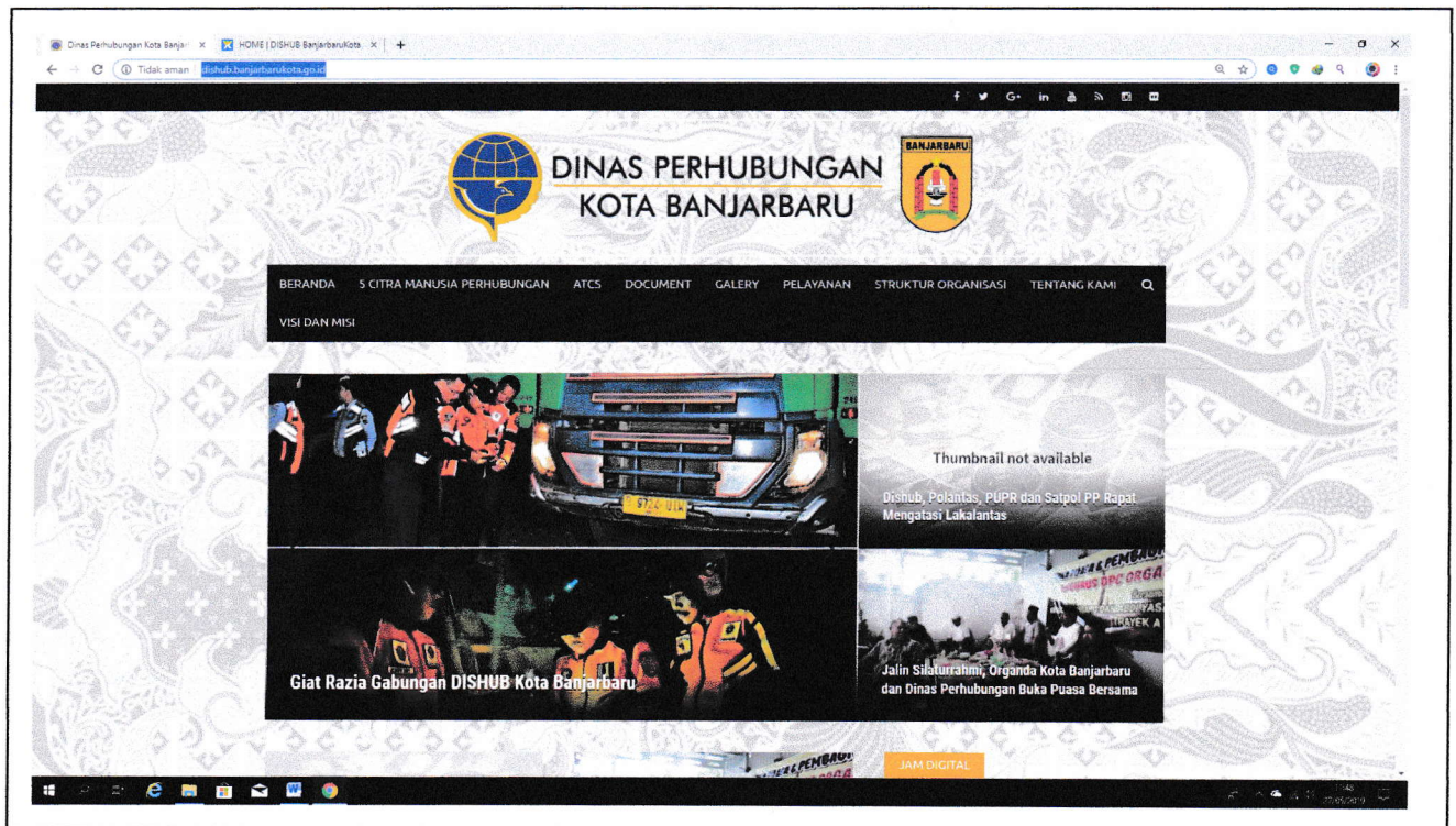
Gambar 1 : http://dishub.banjarbarukota.go.id/

Dalam penyampaian pelayanan pada Dinas Perhubungan guna memberikan Informasi Layanan kepada Masyarakat adalah melalui Media Website dengan situs http://dishub.banjarbarukota.go.id/ yang dapat di akses dengan mudah oleh masyarakat adapun dalam website tersebut berisi beberapa kilasan informasi kegiatan Dinas Perhubungan. Dengan beberapa pengembangan dan penyampaian Data Informasi Pelayanan Publik tersebut maka Dinas Perhubungan menambahkan 1 (satu) lagi informasi website menggunakan pada domain https://dishubbanjarbaru.wixsite.com/dishubbanjarbarukota guna memberikan kemudahan akses berita dan informasi internal maupun eksternal Dinas Perhubungan namun tidak mengurangi eksistensinya sebagai Perangkat Daerah.