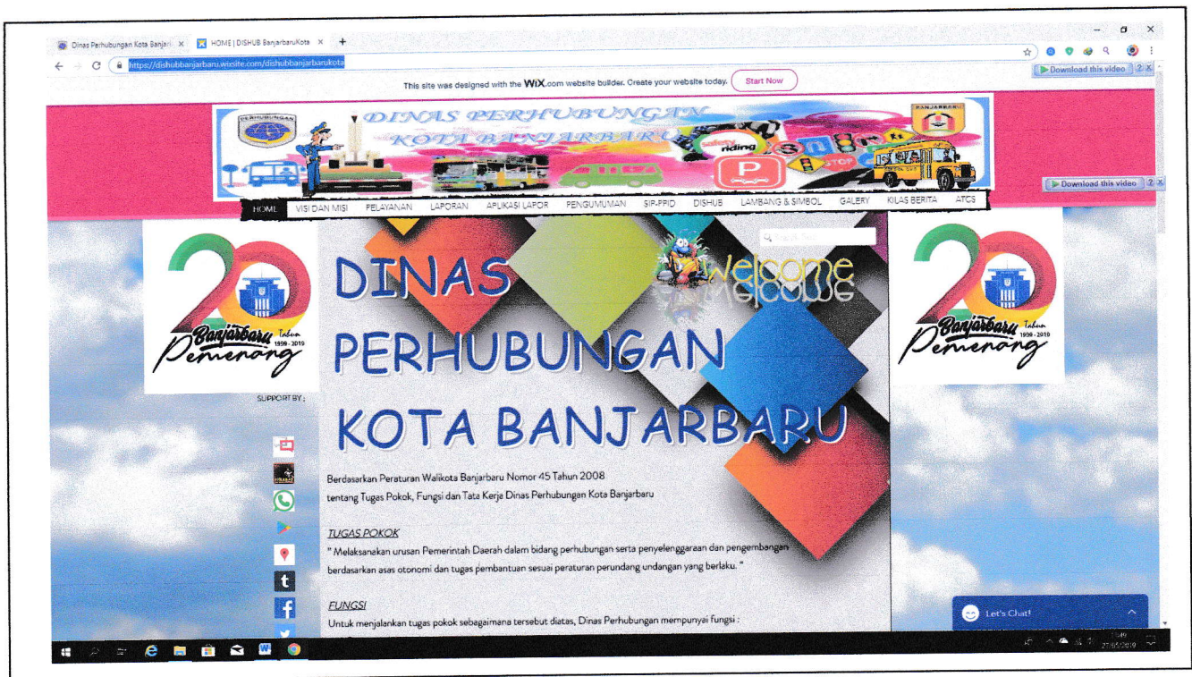
Gambar 2 : https://dishubbanjarbaru.wixsite.com/dishubbanjarbarukota

Di sisi lain penggunaan Media Sosial juga dikaitkan kedalam sumber Informasi guna memperkuat pelayanan dibidang pemerintahan yang mengarah pada 5 citra perhubungan dan visi serta misi Dinas Perhubungan tersebut. Salah satunya adalah menggunakan kilasan berita yang telah di publikasi oleh jurnalis di Media Youtube dan Media Surat Kabar Elektronik sebagai referensi arsip berita adapun berita-berita yang telah tersampaikan ke public melalui pihak jurnalis dari berbagai sumber yang berkaitan dengan Dinas Perhubungan adalah : https://dishubbanjarbaru.wixsite.com/dishubbanjarbarukota/kilas-berita dan himpunan galery kegiatan yang terhimpun di https://dishubbanjarbaru.wixsite.com/dishubbanjarbarukota/galery .