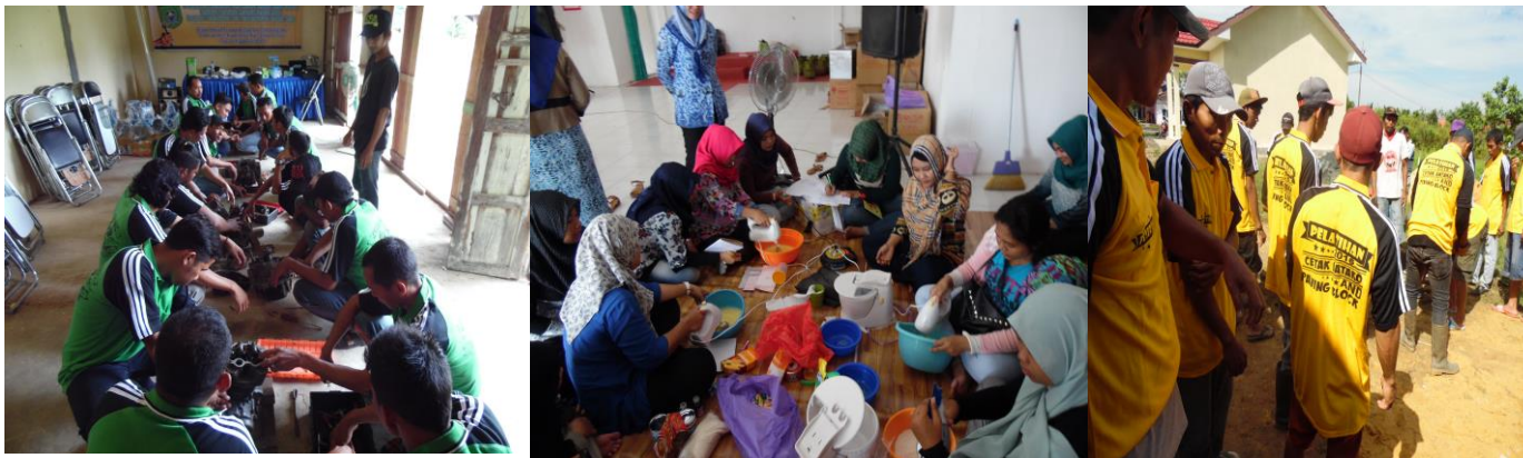
Pelatihan Keterampilan seperti mekanik sepeda motor, tata boga, pembuatan batako, dll.