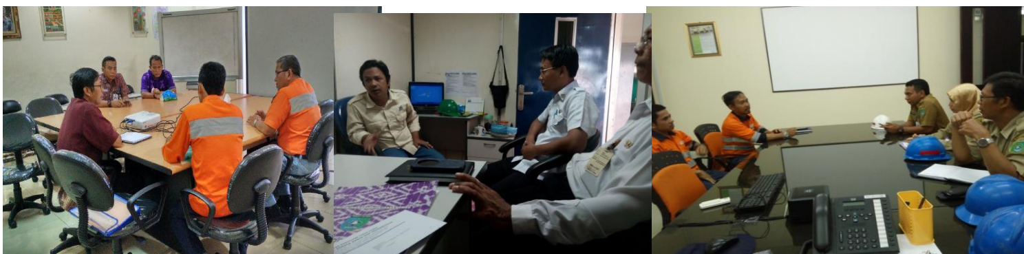
Pembinaan dan Pengawasan Ketenagakerjaan