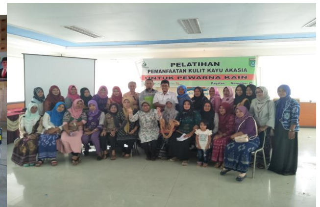
Pembinaan Koperasi dan Usaha Mikro