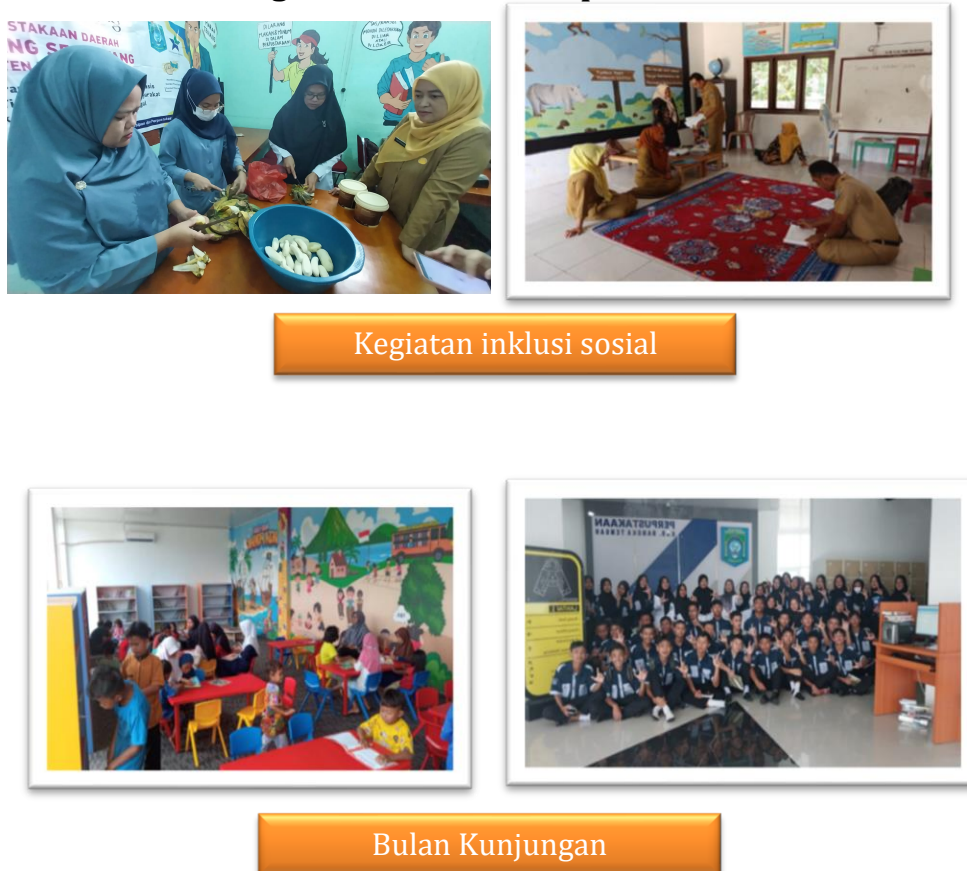
Gambar 3.2 Program Pembinaan Perpustakaan

Sub Kegiatan ini memiliki target kinerja jumlah perpustakaan berbasis inklusi sosial di wilayah Kabupaten/Kota yang dikembangkan sebanyak 5 perpustakaan dan terealisasi sebanyak 35 perpustakaan atau tercapai 100%.