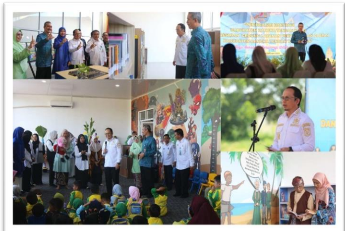
Peresmian Gedung Perpustakaan Daerah