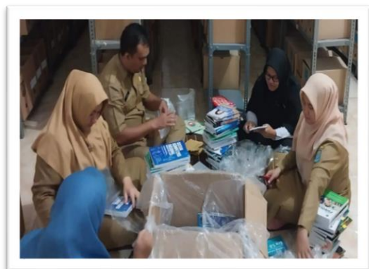
Pengolahan Bahan Pustaka