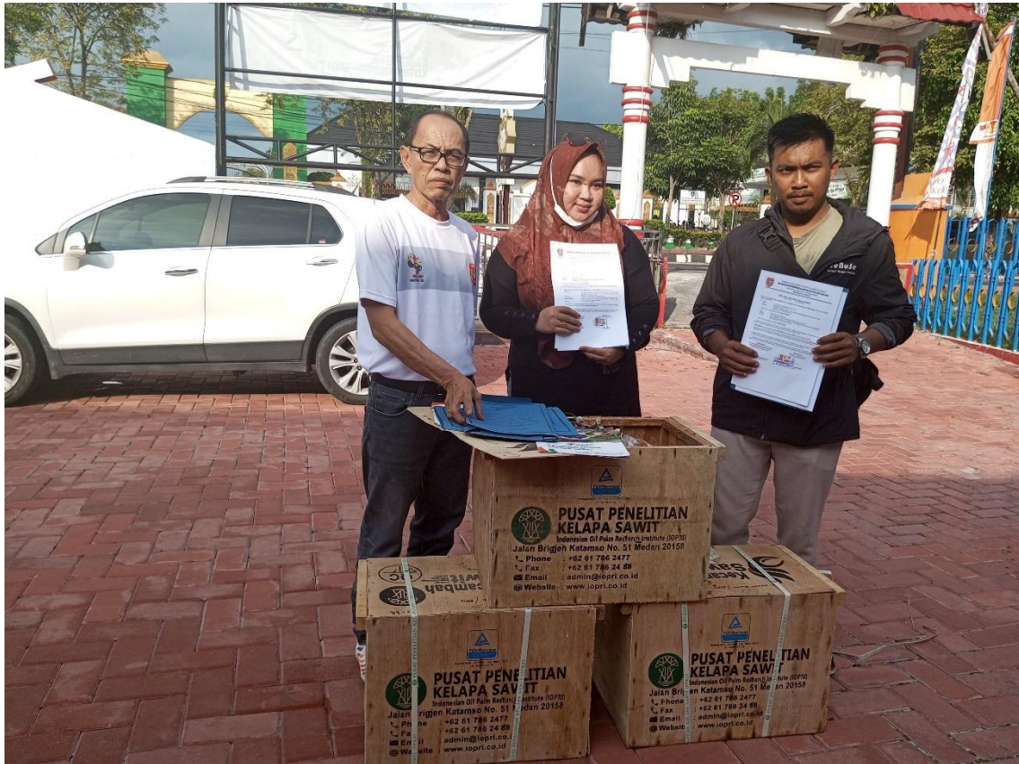
Bantuan Bibit Kelapa Sawit Untuk Kelompok Wirausaha Muda