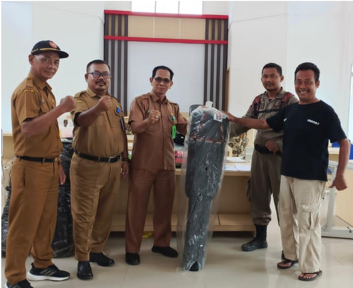
Penyerahan Bantuan Sarana dan Prasarana Olahraga Silat