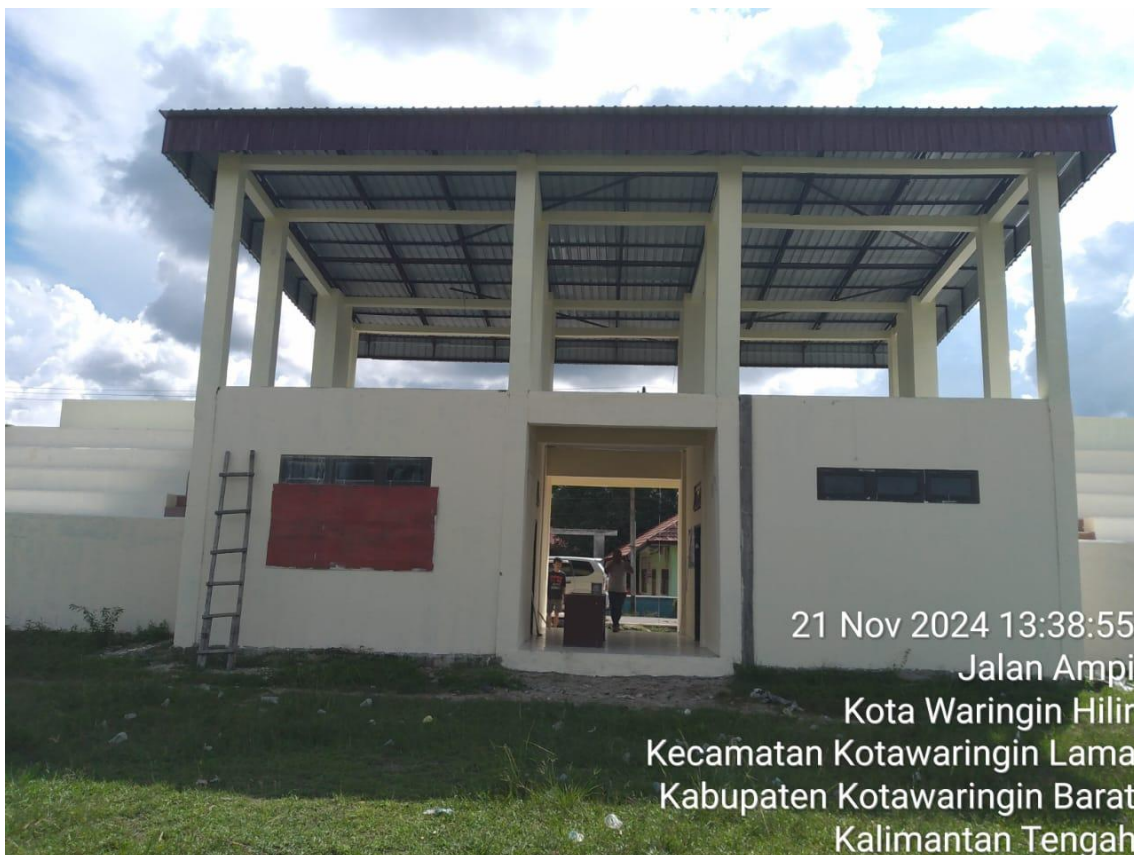
Pembangunan Sarana dan Prasarana Olahraga