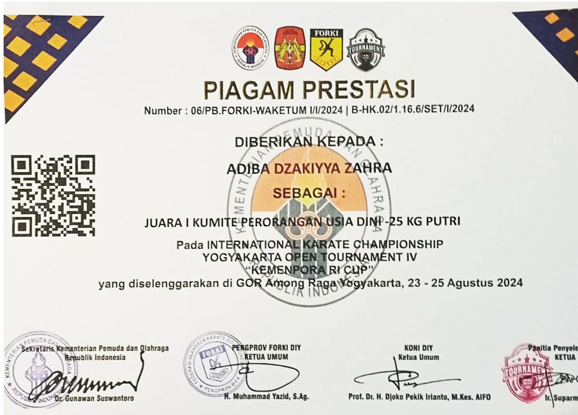
Piagam Prestasi Kejuaraan Internasional Karate Championship Kemenpora