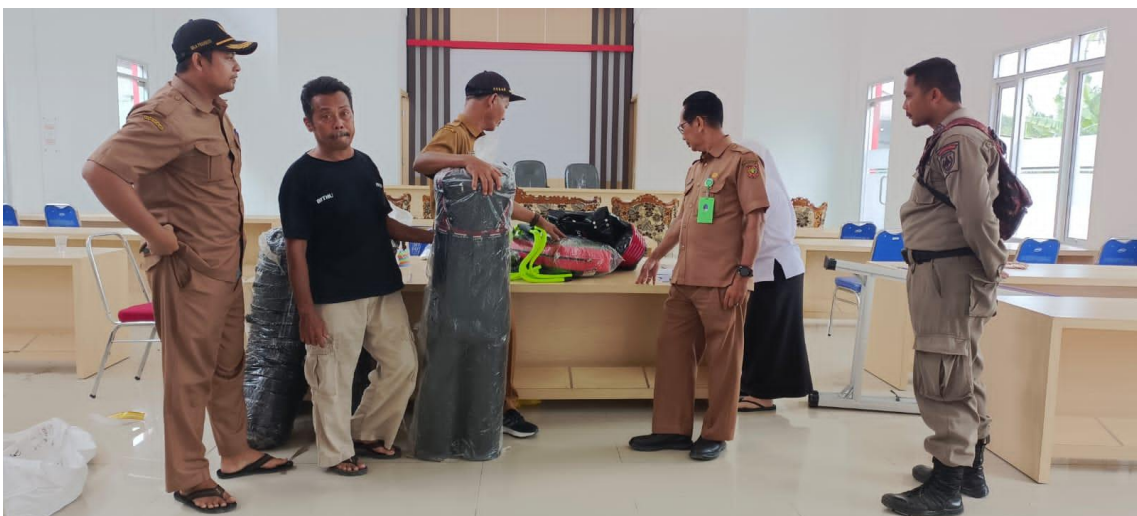
Penyerahan Bantuan Sarana dan Prasarana Olahraga kepada Perguruan Silat