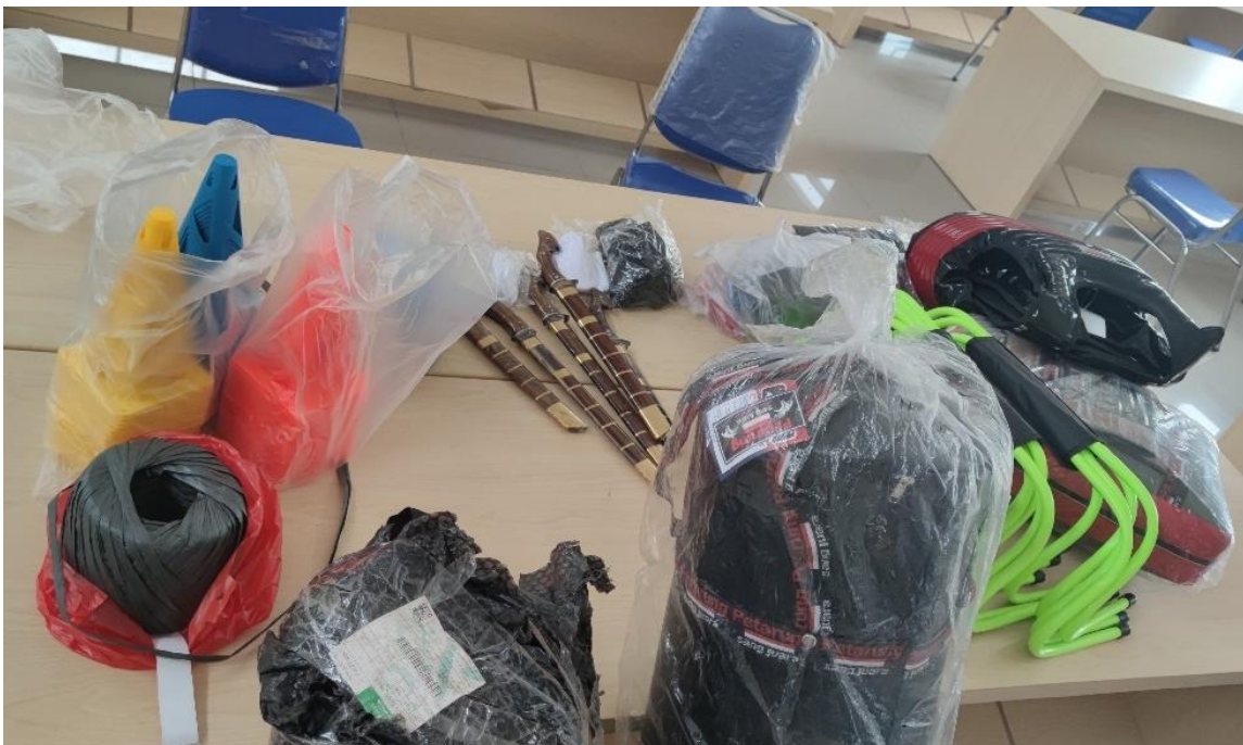
Penyerahan Body Protektor dan Sarana Penunjang Lainnya