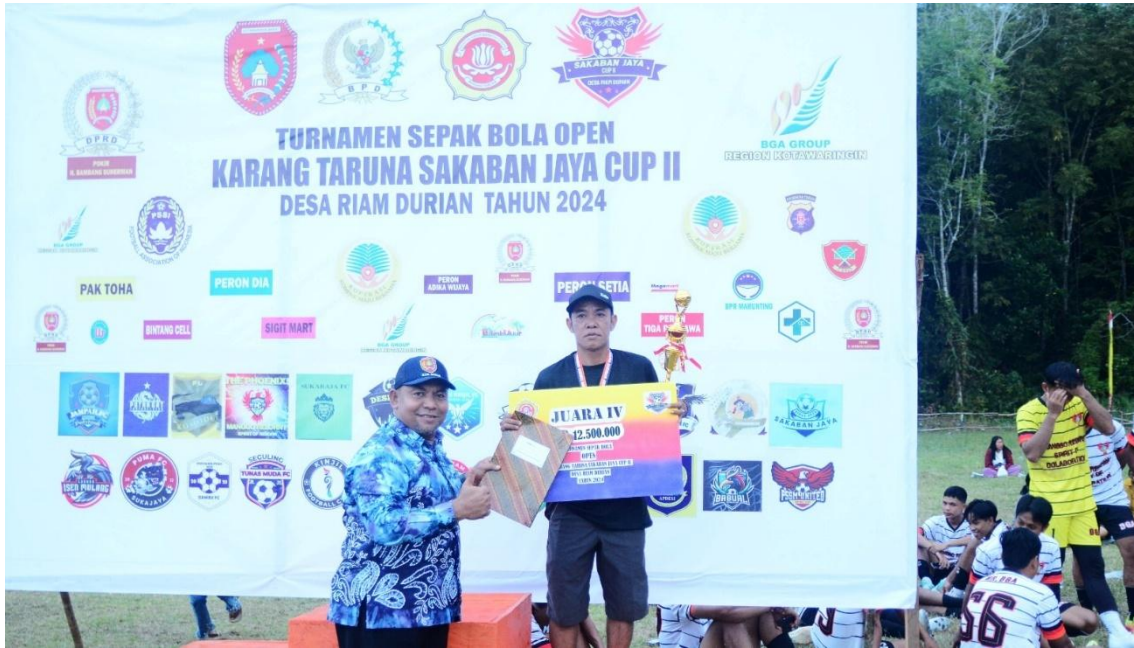
Turnamen Sepak Bola 2024