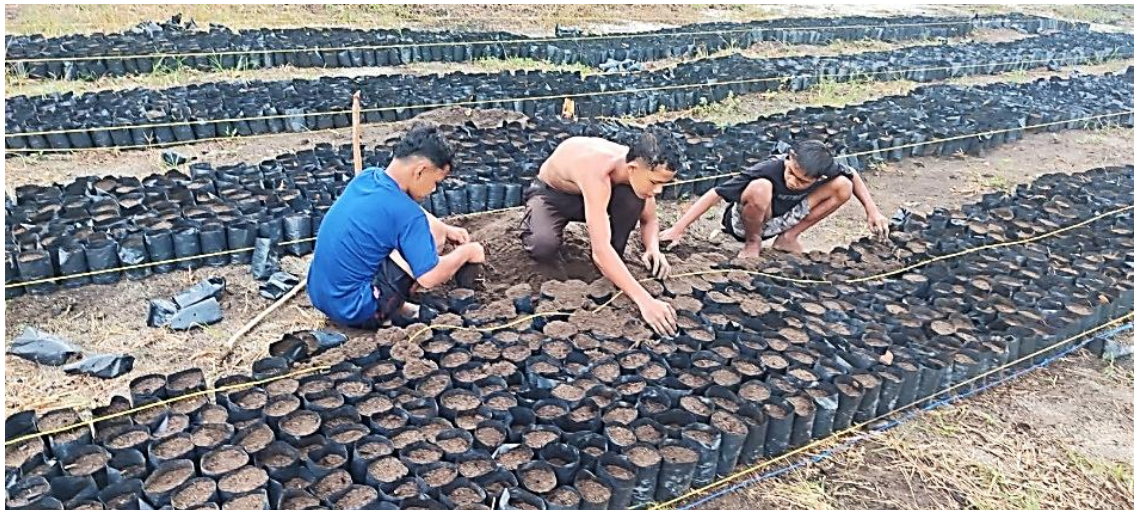
Bantuan Bibit Kelapa Sawit Untuk Kelompok Wirausaha Muda