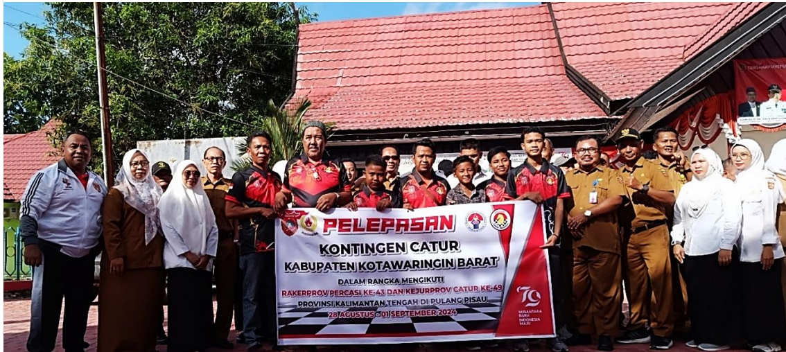
Pelepasan Kontingen Kejuaraan Provinsi PERCASI