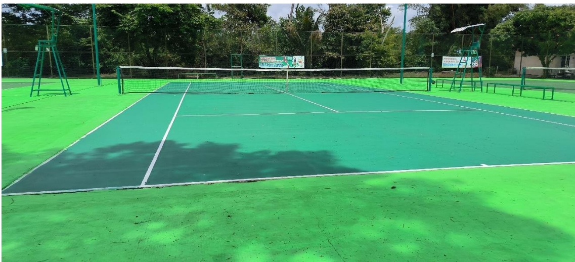
Pembangunan Lapangan tenis