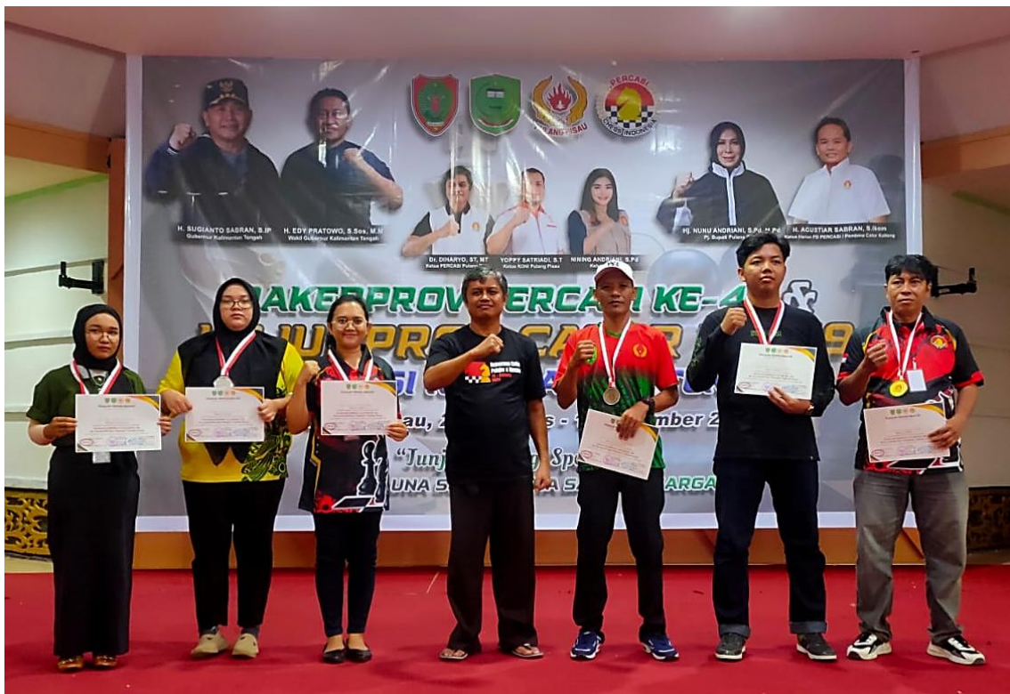
Kontingen Kabupaten Kotawaringin Barat pada Kejuaraan Provinsi PERCASI