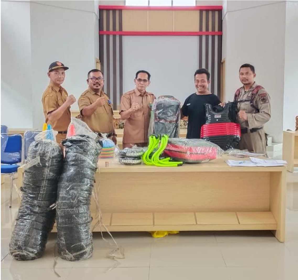
Penyerahan Bantuan Sarana dan Prasarana Olahraga Silat