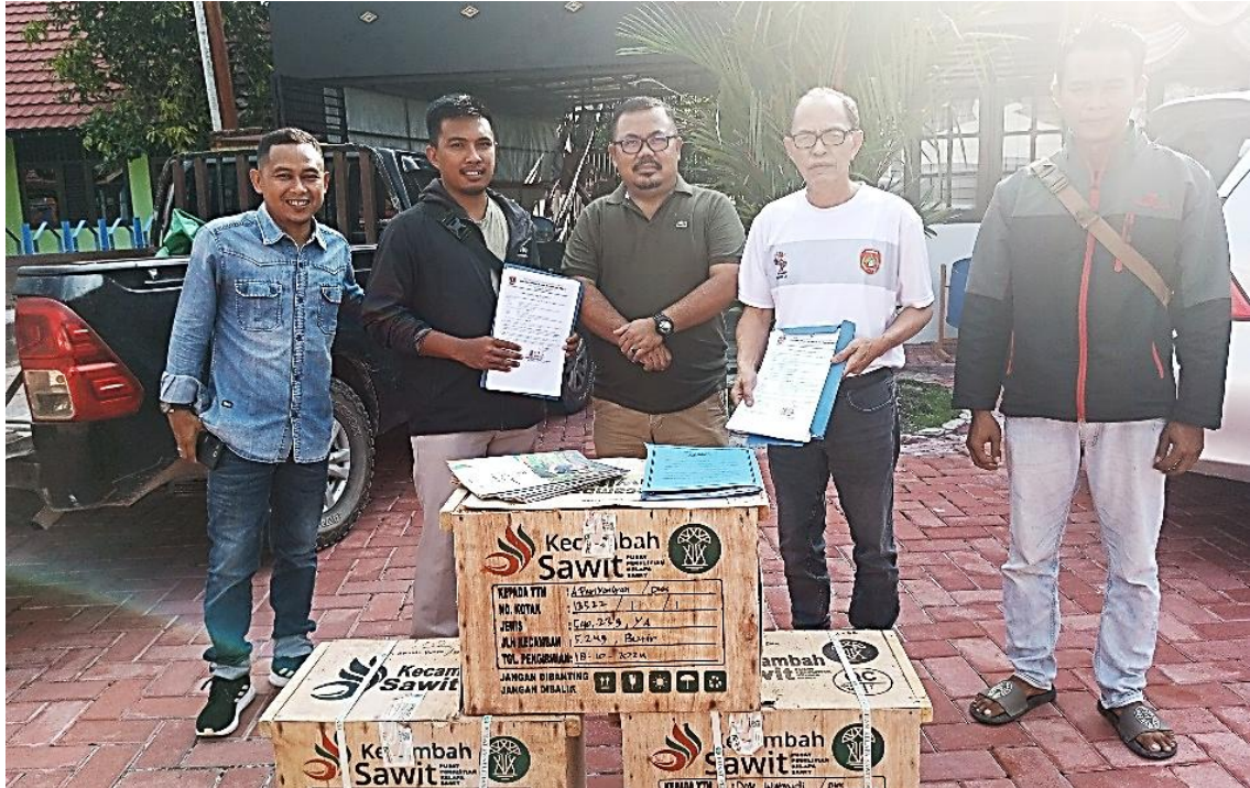
Penyerahan Bantuan Modal Usaha