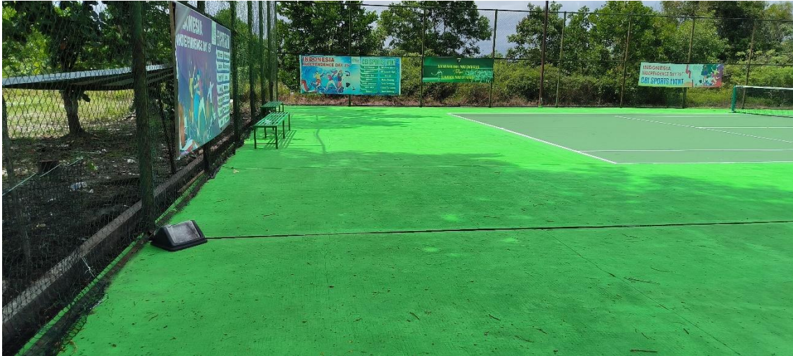
Pembangunan Sarana dan Prasarana Olahraga