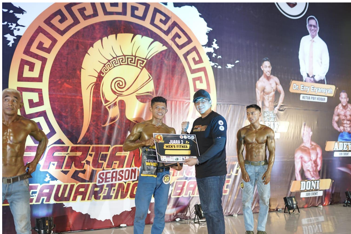
Kejuaraan Binaraga 2024