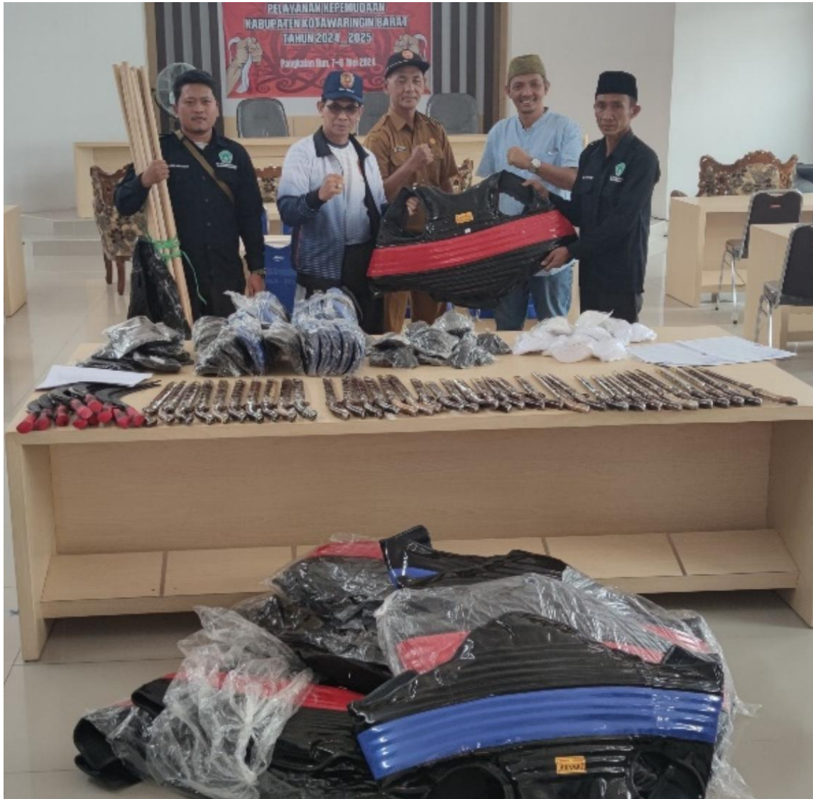
Bantuan Sarana dan Prasarana untuk Perguruan Silat